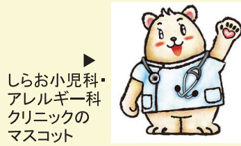
しらお小児科・アレルギー科クリニックのマスコット