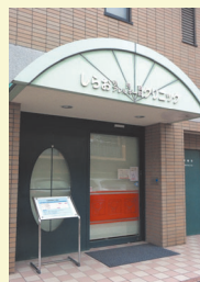
しらお小児科・アレルギー科クリニック外観