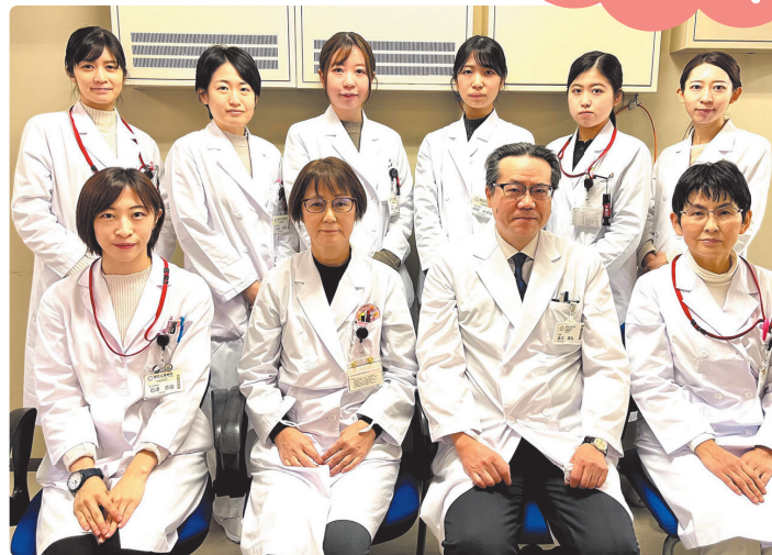
栄養管理科スタッフ