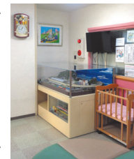
ジオラマのある待合室

○県病院はどんなところで、県病院に一言。 小児科、小児感覚器科、小児外科によく紹介します。小児外科の先生には特にお世話になっております。何があっても受け入れていただき、すぐ来てと言われるので、とても助かっています。受付の方の対応もしっかりとされ、安心してできます。