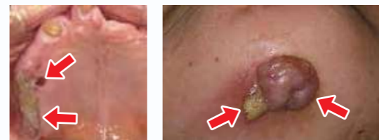
骨粗鬆症、がんの骨転移に用いられる骨吸収抑制薬副作用の薬剤関連顎骨壊死