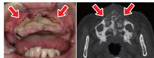
乳がん骨転移に対するランマーク投与に伴う上顎前歯の薬剤関連顎骨壊死

私たちの体では骨をつくる「骨芽細胞」と骨を吸収する「破骨細胞」の働きによって、常に骨の「入れ替え」が行われています。骨吸収抑制薬はこの「入れ替え」に作用し、骨粗鬆症の進行を止めて骨折の予防をしたり、骨に転移したがんの進展を抑制してくれたりします。しかし、これら薬剤が投与されている患者さんにおいて、口腔衛生状態の不良や歯周病などがあると、口腔内常在菌による細菌感染が顎骨に影響しやすくなりMRONJを起こすと考えられています。