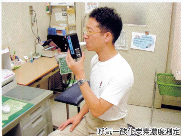
呼気一酸化炭素濃度測定

40%の成功率です。禁煙外来を受診されましたら、まず、問診させていただき、呼気一酸化炭素濃度を測定し、来院者のニコチン依存度、禁煙に対する心構えを分析します。たばこ依存の成立はニコチン依存と心理的依存からなりますが、禁煙外来では、タバコの害についてゆっくり説明し、心理的依存についてどう克服するかサポートし、必要に応じてニコチン置換療法（主にテープ剤）を行います。禁煙に成功した人も平均4回はそれまで失敗しているというデータがあります。はじめての人も、何度も失敗している人も、是非一度禁煙外来にお越し下さい。