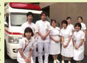
【救急外来の皆さんです】

救急外来は、内視鏡検査・内科処置室・放射線科・脳神経外科外来の4部署のスタッフで構成されています。昼間は各部署で、夜勤の際には救急外来で勤務をしています。私たちは、夜間、地域の医療機関や消防からの要請のほか、急病の方の受け入れを行っています。夜間に来院される方は誰しも「朝まで待てない、つらい」という状態ではありますが、『緊急度や重症度』に応じた対応が基本になりますので、『生命の危険度』が優先されます。状況によって待ち時間が長くなる事もあります。私たちは、来院された患者さんの検査や処置が円滑かつ迅速に行えるように、又、安全な看護が提供できるように医師や検査科と協力し頑張っていますのでご理解をいただきたいと思います。