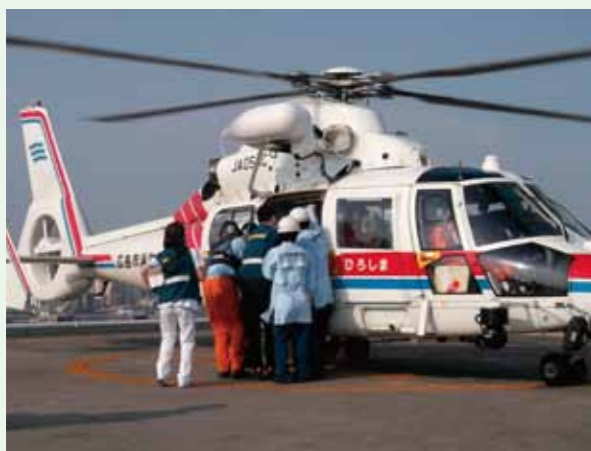
屋上ヘリポートに到着した患者の搬入

広島県では広島県及び広島市の2機のヘリコプターを使用して、山間部や島嶼部を含む広範囲の救命救急患者さんに対し、救命救急センターの医師・看護師が迅速にヘリコプターで救急現場へ出動する体制を整えています。急な怪我や病気になった場所が、大きな病院から遠く離れていたから救命できないという状況は、文明国としてはふさわしくありません。平成25年度からは、広島県によるドクターヘリ専用機の導入も決まっており、さらに多くの患者さんを救命できる体制が期待されます。ドクターヘリ専用機を使って県立広島病院と広島大学病院が受入れる患者さんの数は、さらに増加すると予想されます。