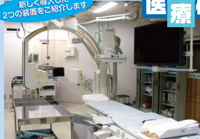
【図1】血管撮影装置外観