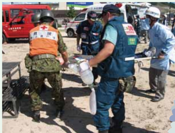
集団災害訓練の様子

災害医療への取り組みも救命救急センターの役割の一つです。平成23年3月11日の東日本大震災に際しては、県立広島病院からは8名のDMAT(災害時医療救護チーム)隊員が同日中に出発し、被災地仙台に赴いて直接の災害医療に携わりました。次に起こる災害に対して最大限の備えをするために、院内や院外、さらには国家規模での訓練や研修を日ごろから繰り返しています。