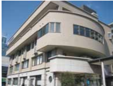
山本整形外科病院外観

どんな患者さんも受け入れてくださり、感謝しています。診療の返事もきちんといただけるので、大変助かっています。