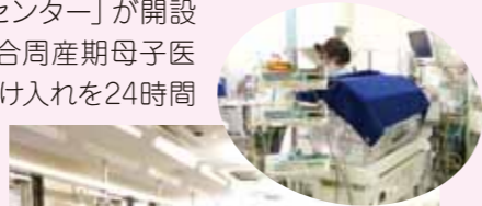
情報の共有を大切にしています

平成21年3月に妊娠・出産・新生児期・小児期・思春期・成人期と継続的なチーム医療を提供するために「成育医療センター」が開設されました。その中の当病棟は県内の総合周産期母子医療センターとして、ハイリスク新生児の受け入れを24時間体制で行っています。後遺症なき生存を目指し、医師・看護師・臨床工学技師・臨床心理士・社会福祉士・病棟業務嘱託員・医療事務など他職種と共に小さな大切な命と向き合い治療、看護を提供しています。ファミリーケア、育児支援などを積極的に行い、退院が決まれば地域の医療機関と連携してご家族が安心して退院していただけるよう看護を行っています。赤ちゃんのために心地よい、優しい環境を提供するために話し合いの場を多く持ち、情報の共有を大切にしています。又、私たちスタッフも長期間懸命に頑張っている小さな赤ちゃんの生命力、そばで支え共に成長していけるご家族の姿に日々感動し、笑顔と大きな力をいただいています。