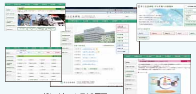
新しくなったTOP画面

県病院のホームページをリニューアルして、TOP画面からの検索がラクになりました。KB ネットやがん医療への取り組み等のページも随時更新して参ります。その他、栄養管理科からは季節に合わせたレシピを公開中ですので、ぜひお役立て下さい。