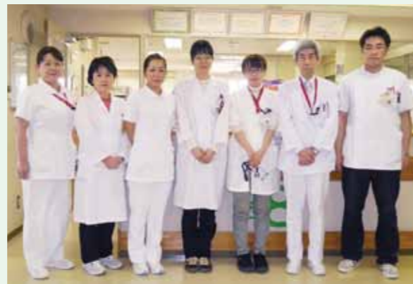
糖尿病・内分泌内科スタッフです

頻回インスリン皮下注射療法でも血糖コントロールが困難な患者さんに対しては、専用の注入ポンプを用いて、持続皮下インスリン注入療法を行っています。また、これまでの経口血糖降下薬とは作用機序が異なる新しい経口血糖降下薬が近日中に使用可能となる予定です。従来の経口血糖降下薬では、血糖コントロールが不十分な患者さんに対しては、従来の経口血糖降下薬を新しい経口血糖降下薬に変更したり、従来の経口血糖降下薬に新しい経口血糖降下薬を追加したりして治療することも可能です。しかしながら、新薬には予期せぬ副作用が起こる可能性があることも否定できません。新薬を投与する際には、患者さんに有害事象が起こらないよう、慎重に経過を観察しながら使用していく必要があると考えています。