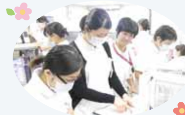
声を掛け合い、日々取り組んでいます

歯科・口腔外科は、口腔がん、顎顔面外傷などの患者さんを受け入れています。それぞれの科は関連性があるため、週1回の合同カンファレンスで放射線科医師も交え、患者さんにとっての最善を検討しています。入院、退院の患者さんが多く、手術件数の多い(院内全手術の1/3を占める)病棟ですが、スタッフは声をかけ合いチームワーク良く働いています。患者さん、ご家族との一期一会を大切に、心のこもった暖かい看護が提供できるよう日々取り組んでいます。