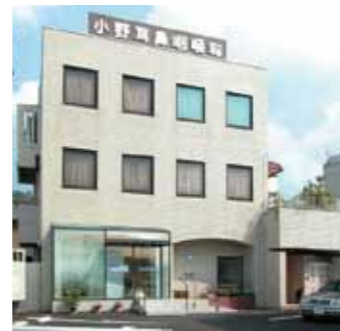
小野耳鼻咽喉科外観

KBネットは患者さんの状態だけでなく治療の方針や過程もわかりますので、新しく患者さんを紹介する時には前もって県病院での治療の流れを詳しく説明することができます。KBネットはそうした情報すべてが見られるので大変良いですね。