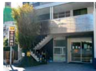
半田耳鼻咽喉科医院外観

急患への対応が早く、本当に頼りになる存在です。連携している患者さんの情報もしっかりといただけており、助けております。