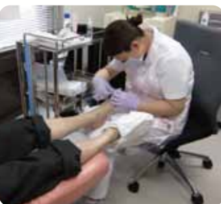
フットケアの様子

『糖尿病チーム』は患者さんの糖尿病に関する様々な知識の習得と合併症の検査を目的とした、2週間の糖尿病教育入院を実施しています。